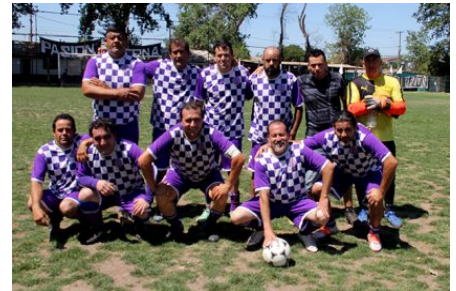
☒ Senior "D" aAbrazo de Maipú, Campeón de la serie Campeonato 2019_2020