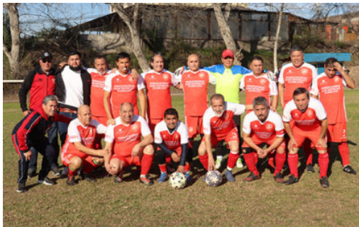
Senior "D" puede obtener su primer triunfo

Dirigentes y jugadores esperan que los 80 m/m de agua que se estiman caerán este fin de semana en este sector central no se cumpla; los pronósticos indican que la lluvia llegara esta noche de viernes no se cumpla e impediría que se continúe con el torneo ya que 12 partidos en dos días dejarían las canchas inutilizadas para una buena práctica deportiva, pero no es eso lo que más preocupa: faltan 13 fechas para concluir el torneo, con festivos en Fiestas Patrias, es decir cuatro meses, lo que indica que se está al límite de tiempo si se quiere finalizar el torneo antes de que termine el año.