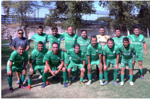
Senior "C" Deportivo Maipú