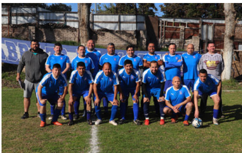
senior C_Abrazo de Maipú

Abrazo de Maipú distrajo el menos 6 puntos donde los méritos son para Patrona de Chile, Cañón Alonso no pudo ganar en primera adulta y perdió importantes puntos y mejoró Séptimo de Línea en infantiles, recuperando poco a poco el protagonismo