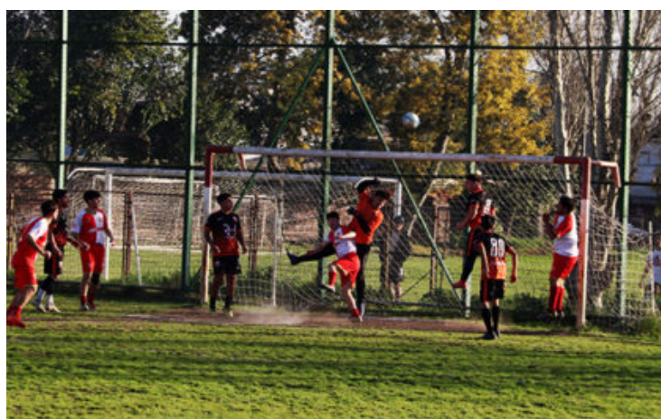
1a Cañón Alonso_Vivero

Si bien es cierto el arquero de Cañón se comió un gol en un amala contención, impidió unos 6 o 7 goles con reflejos no esperados, entre ellos un penal que el mismo se vio obligado a conceder, tapando y luego conteniendo la insistencia en meritoria jugada.