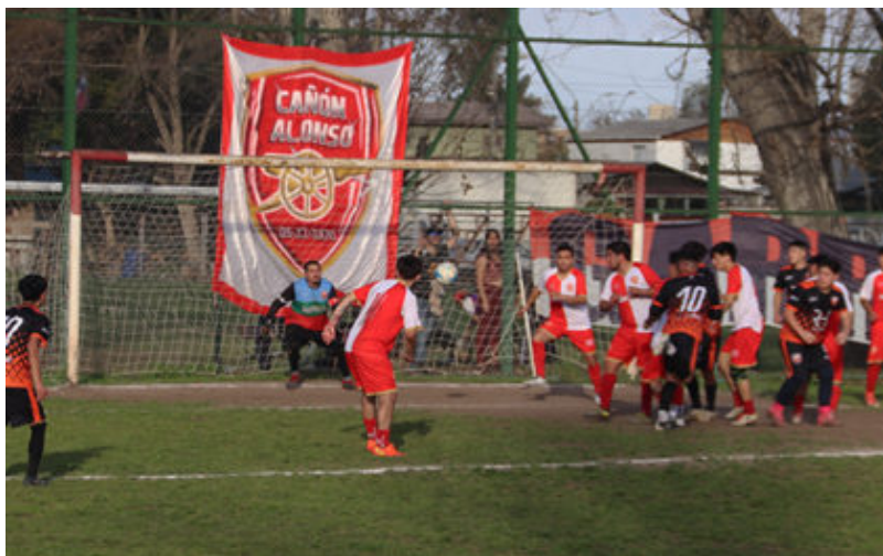
1a Cañón Alonso_Vivero-2

Abrazo de Maipú juega en la próxima fecha de visita ante Real Flandes, club que es su escolta en la rama Adulta a 4 puntos.