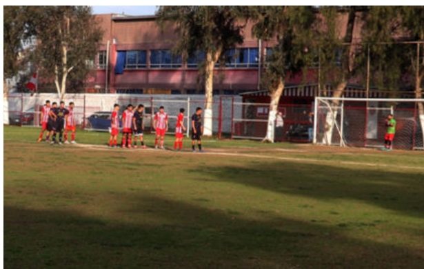
1a Adulta Cente_Flandes

Abrazo perdió la oportunidad de volver a ser líder del torneo de clausura por puntos que no debió perder ante Patrona de Chile, uno de ellos en primera infantil, que, si bien es débil, permitió que Patrona de Chile obtuviera su primer triunfo en 8 fechas, mostrando que su constancia está dando resultados. Otro tanto se esperaba más de senior "B", aunque Patrona de Chile está entrando en confianza en el torneo apoyado en la gran campaña del senior "A", líder en esa serie con 30 puntos de los 32 disputados.