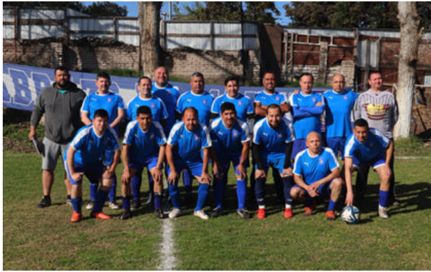
Senior "C" de Abrazo de Maipú

Abrazo de Maipú es puntero en senior "E" y primera adulto, ambas en calidad de invictas, siendo además líder en la Rama Adulta y Rama Senior. Si mejora en infantiles el título lo espera.