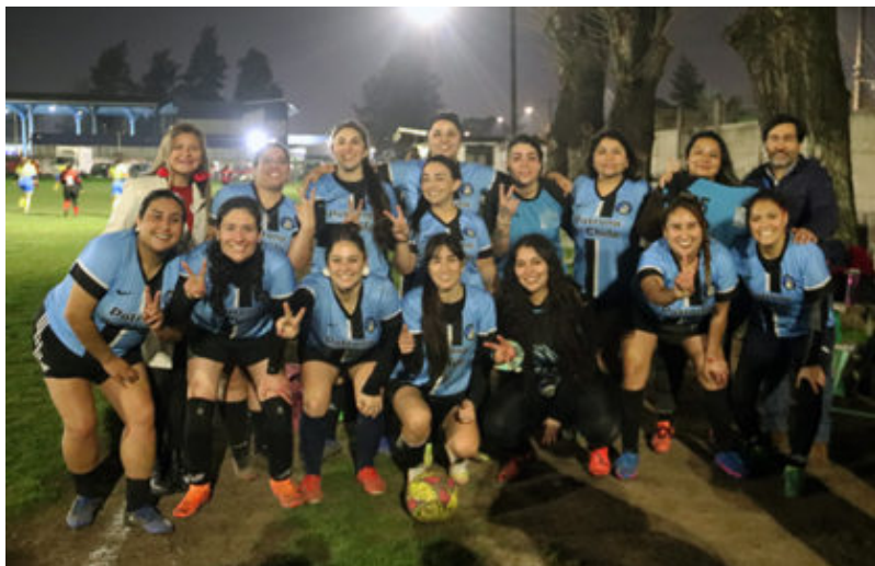
Patrona de Chile