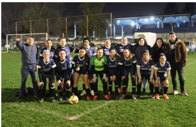
Abrazo de Maipú

Anuncios de lluvia hacían temer que se paralizara el juego, pero nada paso y se jugaron los 3 partidos programados, donde en cada uno se decidía algo. Este sábado 2 de septiembre de 2023 concluyó el hexagonal de invierno de la Liga Femenina de Fútbol de Maipú, LIFEM, con tres partidos disputados en el Estadio de Campo de Batalla.