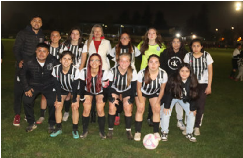
Campo de Batalla