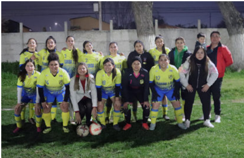
Florida Loma Blanca