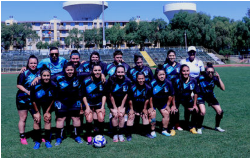
Pajaritos de Maipú campeona 2023 del tornero clausura de la Lifem

Finalizó el Campeonato de Clausura de la Liga Femenina de Fútbol de Maipú, LIFEM, tras ocho fechas de intenso despliegue deportivo donde cada mujer dejó lo mejor de su labor deportiva defendiendo su camiseta. Muchas estudiando, otras trabajando y varias mamás que dejaron por un momento su labor en casa para brindarse por entera a esta naciente liga de fútbol.