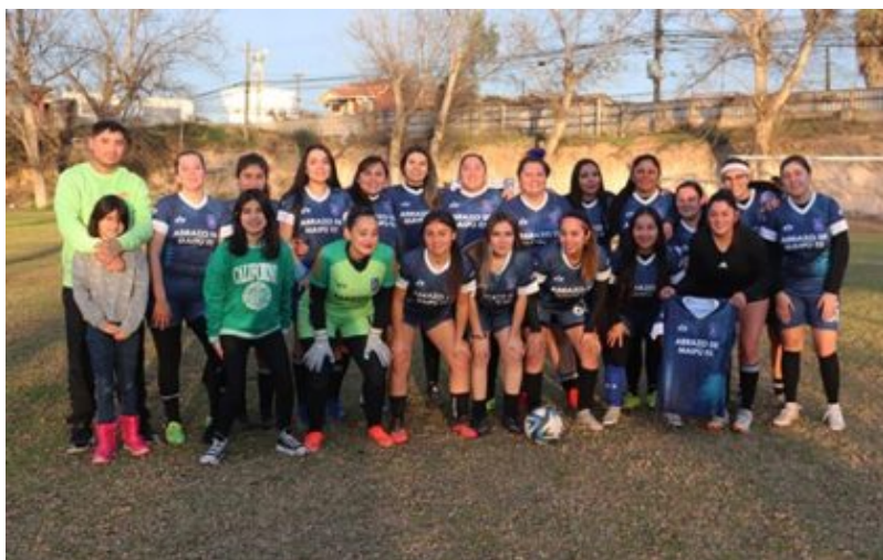
Abrazo de Maipú

El esfuerzo de varios dirigentes y el aporte sustantivo de un centenar de jugadoras dará este sábado el inicio del tercer campeonato femenino de fútbol de Maipú, agrupados en a LIFEM, Liga Femenina de Fútbol de Maipú.