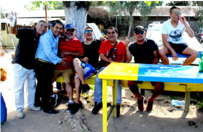
Barra Florida Loma Blanca.

Lamentablemente son dos los clubes cuyos dirigentes no responden los llamados para corroborar resultados, tema que nos complica los resultados sino estamos presentes en cancha, es el caso de esta novena fecha donde aparece en planilla ganando Cañón Alonso a Séptimo de Línea en segunda infantil, resultado que fue al revés. Ganó Séptimo de Línea dos minutos antes del término del partido, pero ese resultado nos pudo llevar a error involuntario.