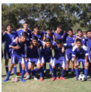
Senior "D" aAbrazo de Maipú, Campeón de la serie Campeonato 2019_2020