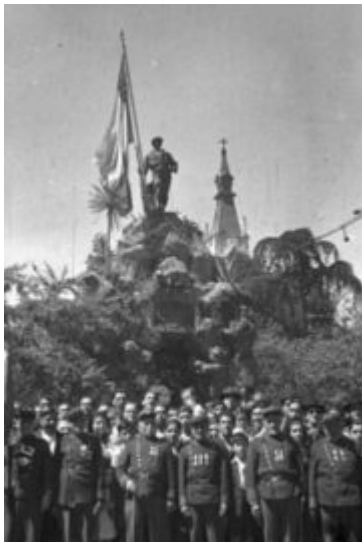
Batalla de Yungay, 20 de enero de 1839