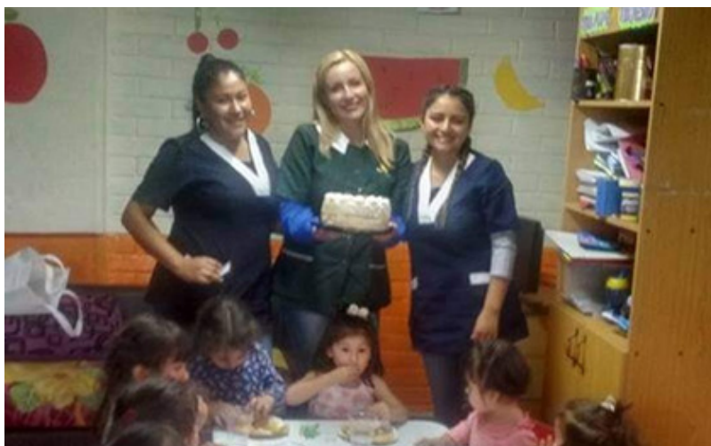
Años atrás, cuando celebraba junto a

Este año entra a la edad de las mujeres interesantes y apagará las velitas con el aforo permitido, solo su familia, a diferencia de otros años que era más masiva, pero sin duda que la pandemia la afectará, pero le ha dado nuevos bríos para salir adelante y concretar su sueño..