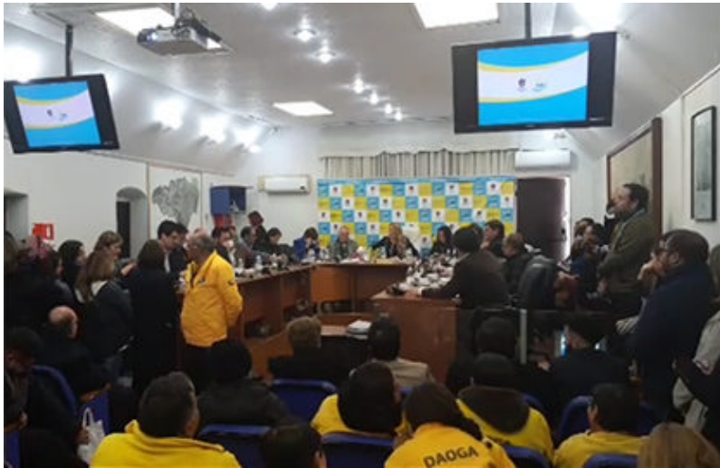
¿Se mantendrá el telón de fondo y las chaquetas amarillas?

95 candidatos son los postulantes hasta el momento los candidatos a concejales por Maipú que representaran a 12 pactos políticos se presentaran en las elecciones que definirán el nuevo Concejo Municipal para el periodo 2021-2024, periodo corto para adecuarse a la extensión de este periodo a causa de la pandemia. 16 candidatos fueron rechazados y tienen plazo 5 días para reclamar al TER (Tribunal Electoral Regional) y luego 5 días más para apelar al TRICEL (Tribunal Calificador de Elecciones)