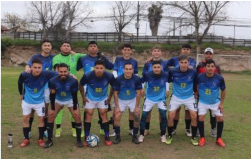
Abrazo de Maipú

mantiene dos series punteras, pero pierde por un punto el liderato de la Rama Adulta ante 2 resultados adversos no contemplados en los pronósticos; Deportivo Maipú quiere estar entre los 6 primeros, Real Flandes es el nuevo líder en la Rama Adulta YU Cañón Alonso no avanza del 5º lugar y las infantiles siguen respondiendo mientras que las adultas están muy irregulares.