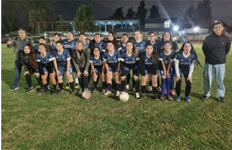
Abrazo de Maipú