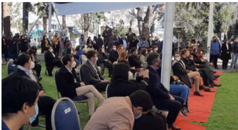
Foto archivo instalación de este concejao que esta cumpliendo su periodo.

Este viernes 6 de diciembre de 2024 asume su segundo periodo alcaldicio el sociólogo Tomás Vodanovic, fecha de instalación del 9º Concejo Municipal pos dictadura, que tiene novedad 4 nuevos integrantes y por primera vez habrá oposición. La hora de inicio de la ceremonia está fijada a las 10:00 horas, trascendiendo un invitado estrella: Claudio Orrego.