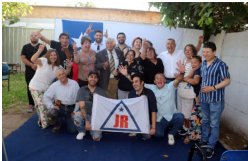
FOTO CON RADICALES ORDENADOS

La jornada finalizó con un vino de honor al estilo Radical.