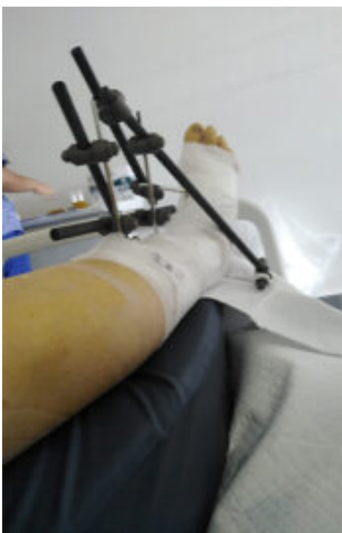
Foto enviada hoy tras intervención.