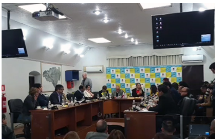
Foto Concejo