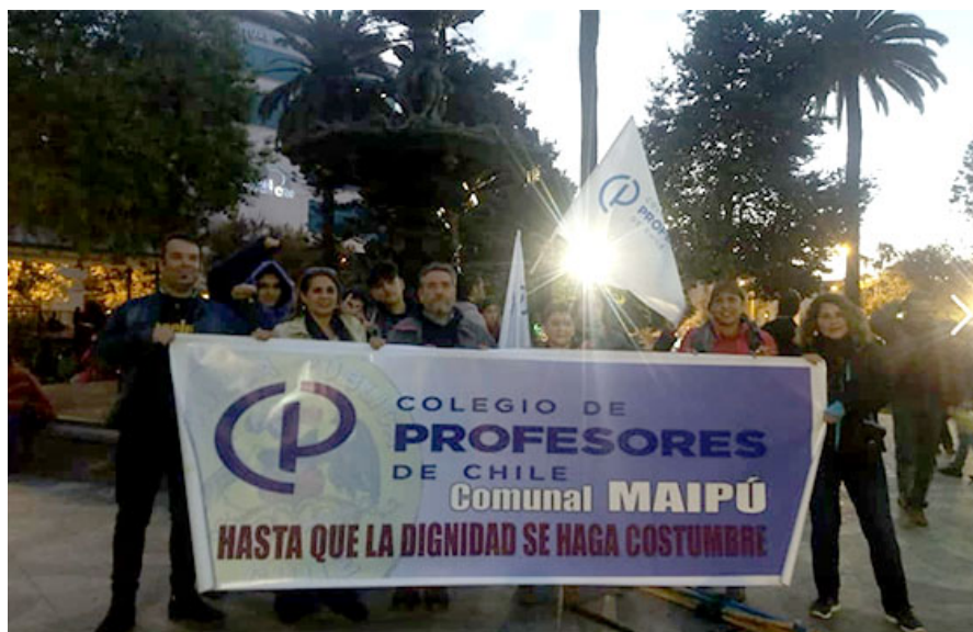
FOTO PORTAL COLEGIO PROFESORES MAIPU

La asamblea nacional del Colegio de Profesores resolvió el 24 de mayo llamar a un Paro Nacional de actividades como una forma de presionar a que se entreguen respuestas a las propuestas realizadas en la Mesa de Trabajo, ya dilatada por varios meses. En Maipú el Colegio de Profesores local llamó a reunirse este lunes 3 de junio (10:00 horas) en el acceso oriente del Templo Votivo y marchar hacia la Plaza de Maipú.