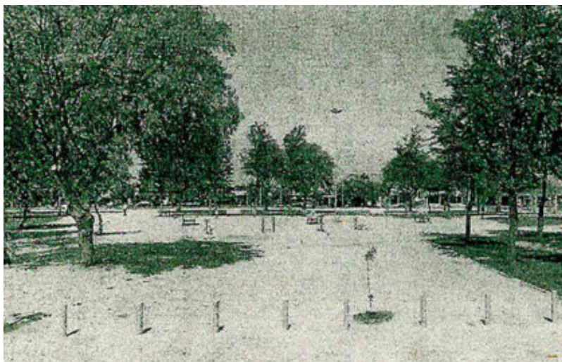
San Martín con Tres Poniente