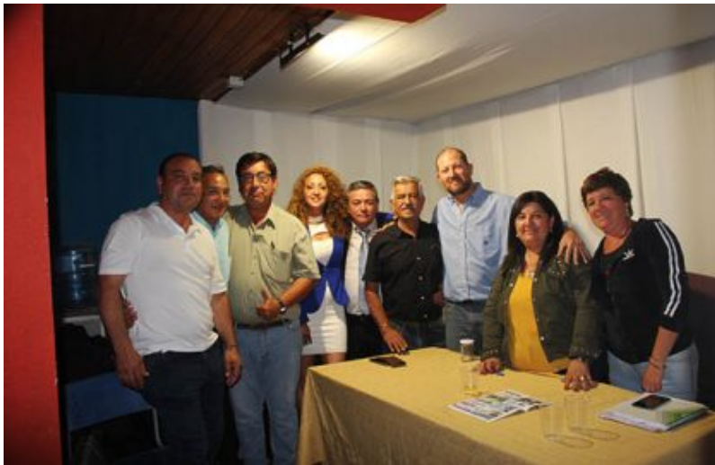
Foto postulantes diciembre de 2019 junto a Comisión Electoral

El 13 de diciembre se realizaran las elecciones en el Sindicato de Trabajadores a Honorarios de la Municipalidad de Maipú (STH). El horario de recepción de votos es desde diciembre desde las 10:00 a las 18:00 horas.