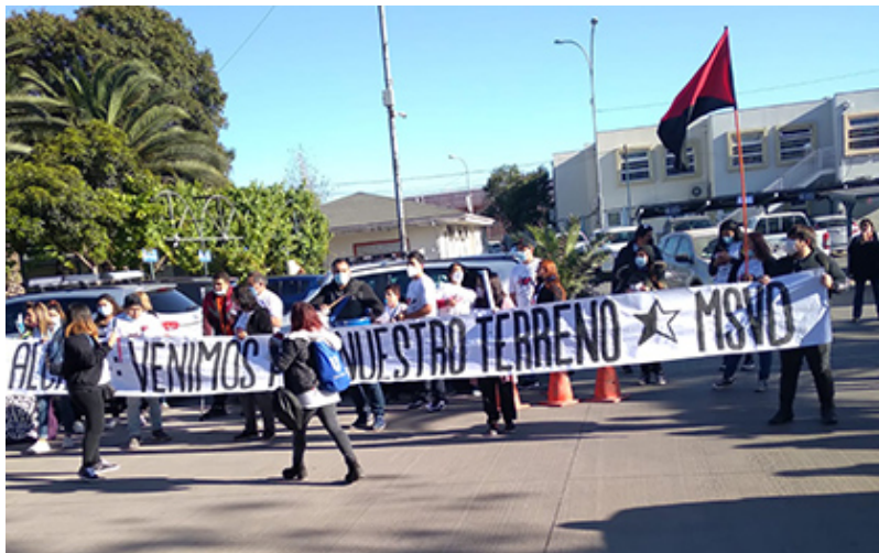
Imagen enviada por lector

✖ Vecinos organizados en agrupaciones “Sin Casa” se tomaron la Municipalidad de Maipú para reclamar terrenos que permitan cumplir su sueño de la Casa Propia.