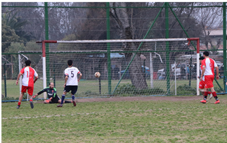
El gol decisivo

Se quedaron esperando quienes deseaban que Deportivo Maipú dividiera puntos con el puntero Unión Viveros. Deportivo Maipú dio ventajas por ausencia, pero el puntero mostró porque es el puntero. Cañón Alonso se ubica tercero, pero a 38 puntos lo que significa una fecha mientras Campo de Batalla se ubica segundo: Resultados rectificados.