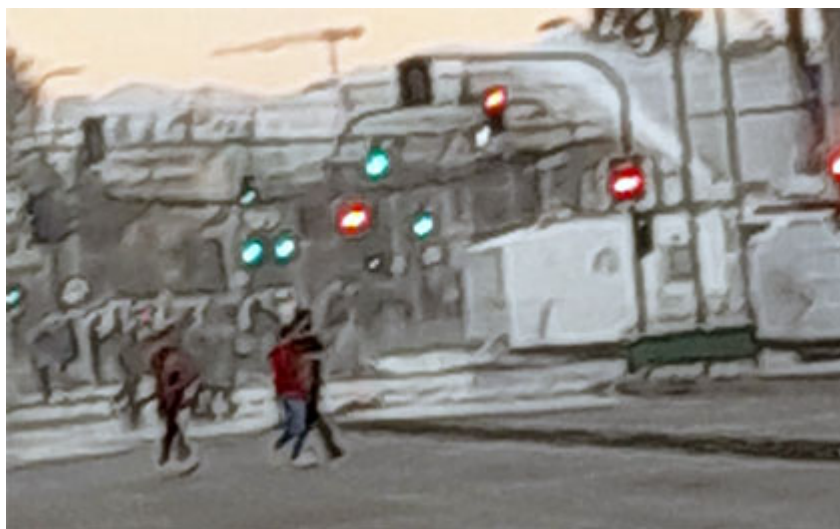
FOTO IMPACTO. 18:00 horas del 08 de agosto de 2022, continua el enfrentamiento de comerciantes ambulantes con carabineros en Av. Pajaritos con 5 de Abril. Este comenzó pasada las 11:00

luego que un grupo de comerciantes informales, que se les impidió instalarse en las calles del centro de la comuna se manifestaron duramente por recuperar los espacios laborales.