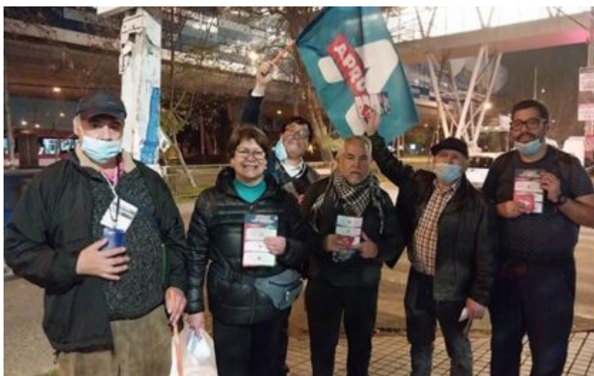
Comando Maipú Aprueba,

Comando Maipú por el Apruebo, Comando Socialismo Democrático, Comando Apruebo Dignidad, Comando independientes por el Apruebo, Comando Profesores_Maipú son parte de los grupos que trabajaron para que la opción Apruebo tenga un buen resultado en el Plebiscito a efectuarse este domingo 4 de septiembre.