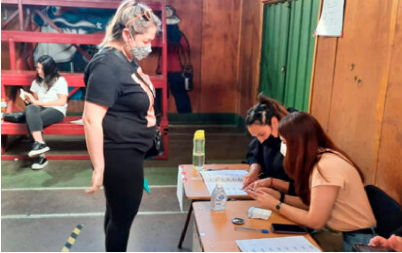
Mi niña sufragando

Se presume que Votarán 320 mil personas en Maipú y el 90% del padrón en todo Chile.