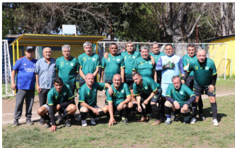
Senior "D" de C.D. Pomaire

En el caso de la Tabla Oficial que comprende las series senior "A", "B" y "C", Florida Loma Blanca ocupaba el tercer lugar y fue desplazado al cuarto al perder dos series ante quien lo seguía: C.D. Pomaire.