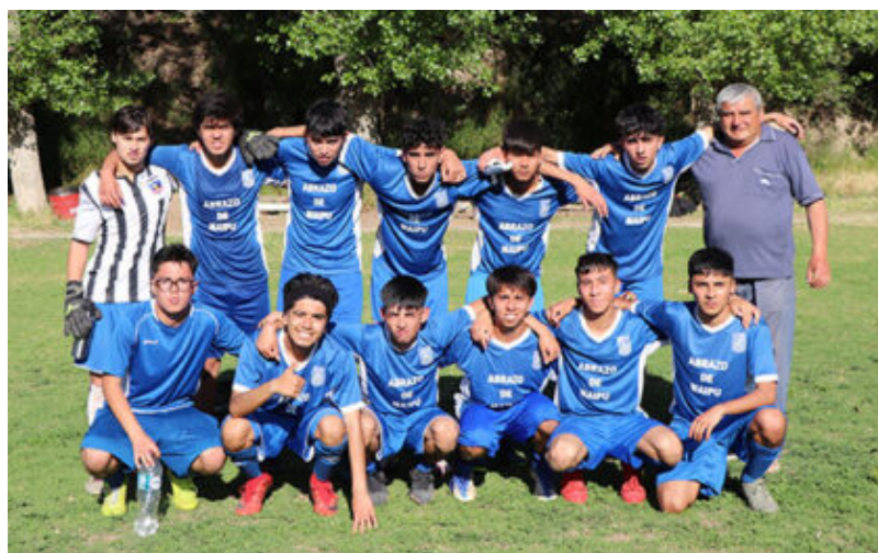
Primera Infantil de Abrazo de Maipú