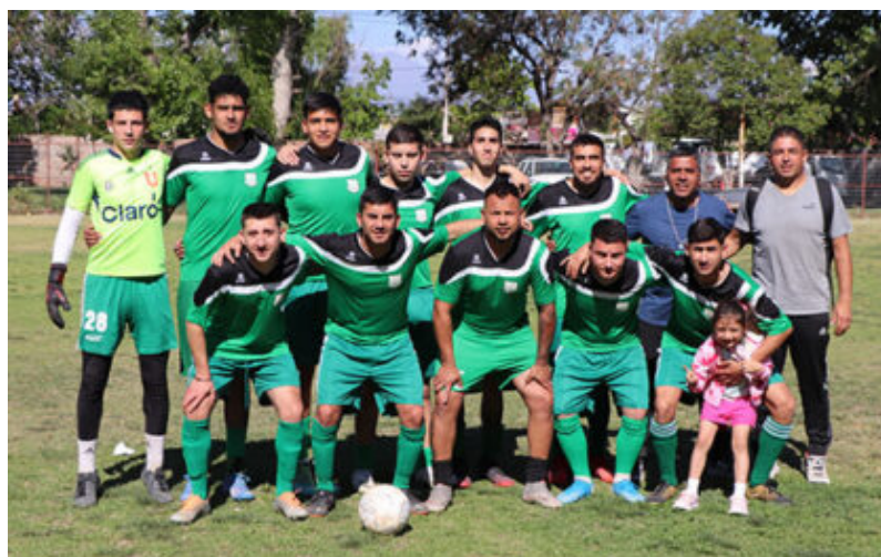
Primera Adulto de Deportivo Maipú

Unión Portales tenía sus expectativas en infantiles durante las \frac{3}{4} parte del torneo, después comenzó a bajar en su rendimiento, se mantuvo en senior con dos destacados en senior "E" y "D" donde pudo dar más si contara todas las veces con equipo titular.