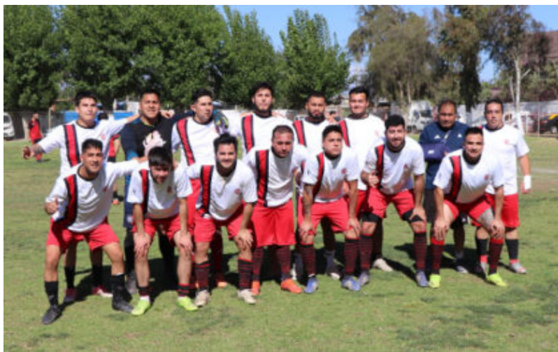
Segunda Adulta de Unión Portales

Unión Portales tenía sus expectativas en infantiles durante las \frac{3}{4} parte del torneo, después comenzó a bajar en su rendimiento, se mantuvo en senior con dos destacados en senior "E" y "D" donde pudo dar más si contara todas las veces con equipo titular.