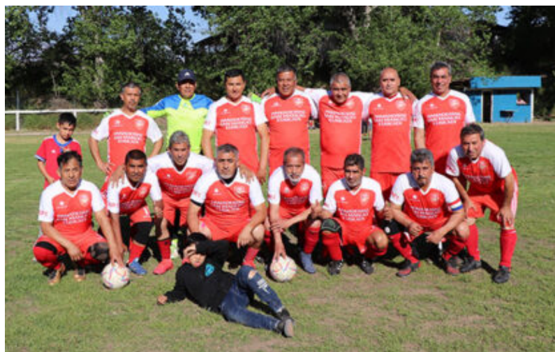
Senior "E" de Cañón Alonso

Unión Centenario tiene como rivales en las dos fechas restantes a Cañón Alonso de visita y a Real Flandes de local.