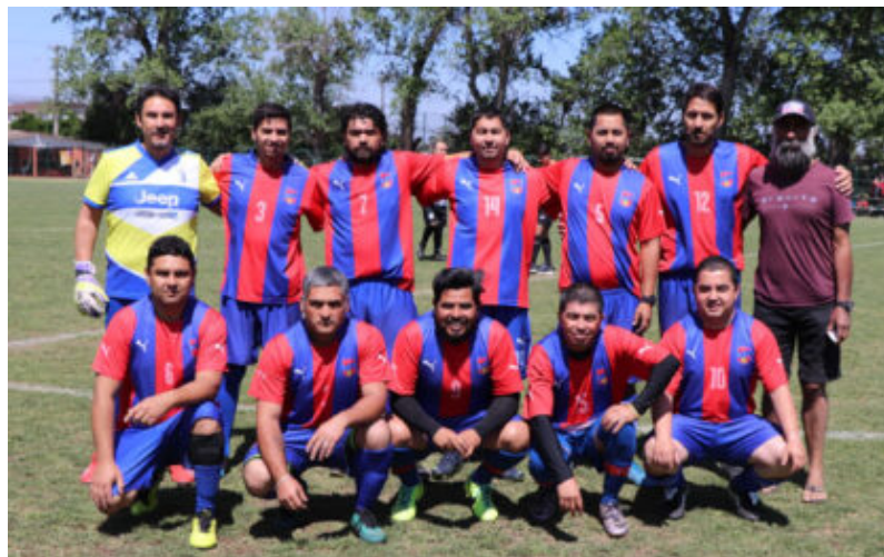
Senior "B" de Abraham Lincoln

Campo de Batalla, a pesar de una gran cifra de puntos perdidos por inscribir tarde a sus jugadores es el puntero indiscutido en la Rama Infantil y a 5 puntos de ser campeón. Ya es campeón en tercera infantil con 40 puntos a dos fechas del término del torneo, a menos que pierda puntos ...por quite de puntos.