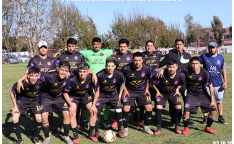
Primera Adulta Real Flandes

Viveros prácticamente campeonando a dos fechas del término del torneo, escapado 62 puntos cuando quedan 76 por disputar, cinco series punteras de las cuales en senior "B" ya es campeona dos fechas del término del torneo.