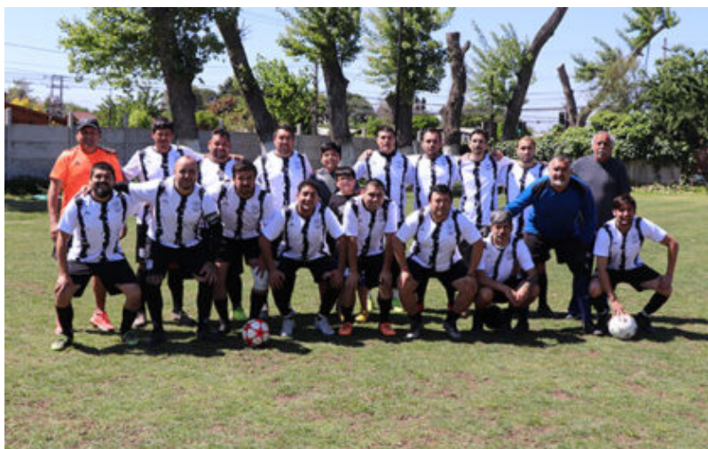
senior "B" de Campos de Batalla

Aquí tuvimos problemas con el envío de resultados del domingo y puede haber algunas diferencias en la Rama Adulta.