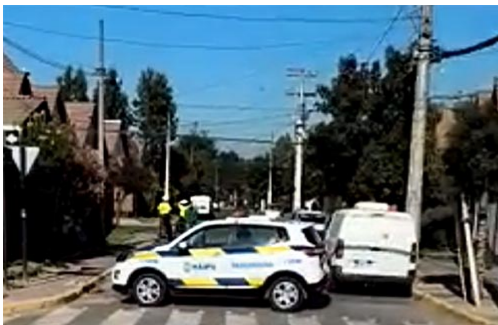
Central, Ciudad Satélite de Maipú.

Esta mañana se llevará a efecto un desfile civico-militar en homenaje al 99º