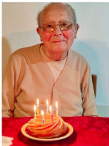
Foto del 14 de marzo de 2025 cuando cumplió 94 años.

Preocupación en círculos cercanos al ex alcalde de Maipú luego que observaran que ya no está en su querida casa ubicada en el Pasaje Isla de Pascua, pasaje ubicado entre Manuel Rodríguez y Hermanos Carrera, vereda sur de calle Chacabuco.