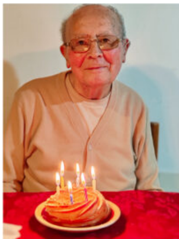
Foto del 14 de marzo de 2025 cuando cumplió 94 años.

Preocupación en círculos cercanos al ex alcalde de Maipú luego que observaran que ya no está en su querida casa ubicada en el Pasaje Isla de Pascua, pasaje ubicado entre Manuel Rodríguez y Hermanos Carrera, vereda sur de calle Chacabuco.