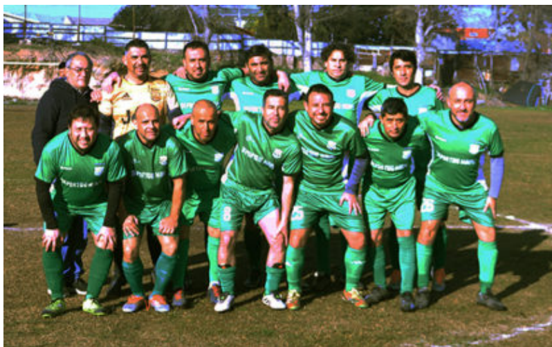
Senior "C" de Deportivo Maipú