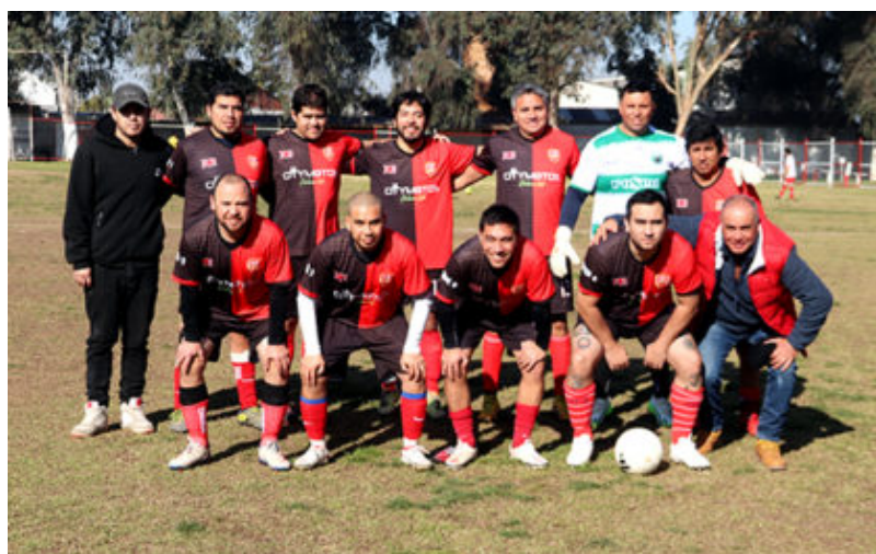
Senior "B" de Unión Centenario

Centenario mejoró en la sénior, donde está su fuerte, sumando 13 de 16,