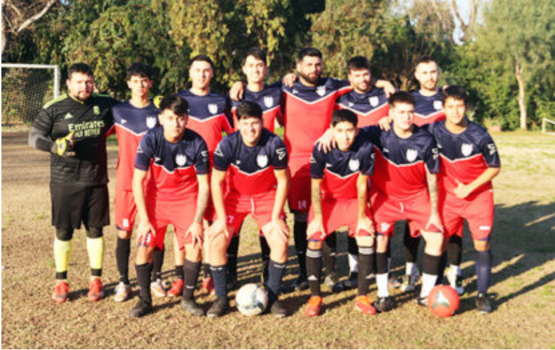
TABLA OFICIAL TIENE DE LIDER A CAMPOS DE BATALLA