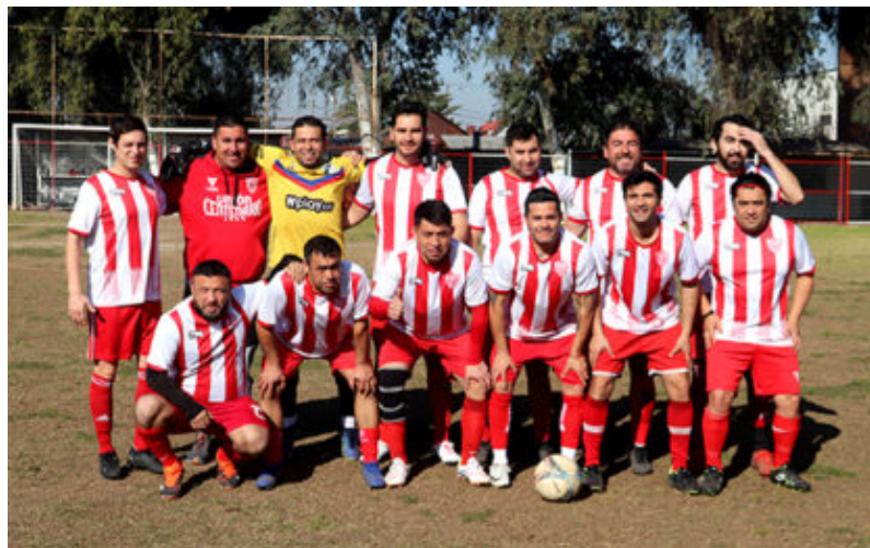
Senior "B" de Unión Centenario

Unión Centenario pasa al 3er lugar en la Tabla general luego de sumar 27 puntos sobre 10 de la visita Cañón Alonso. Los diablos rojos definitivamente perdieron la brújula, con las infantiles, que era su fuerte, no encuentran el rumbo y sólo rescató 4 puntos de 12.