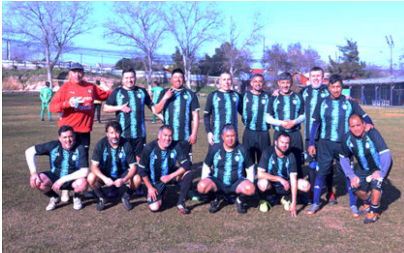
Senior "C" de Patrona de Chile

segunda y primera adulto, teniendo buenos jugadores.