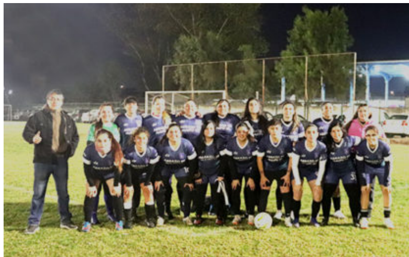
Abrazo de Maipú

En el tercer partido Abrazo de Maipú contra Fénix, el partido fue todo para las chicas de calle Republica, que dominaron casi todo el encuentro, sin llegadas de Fénix al arco azul en el primer tiempo, por lo cual la arquera de Abrazo prácticamente solo tocó el balón en el segundo tiempo. Abrazo de Maipú, es un equipo joven que está jugando con juveniles y menores, proyectándose para el futuro y esperando que de triunfos que estén consolidando un estilo de juego.