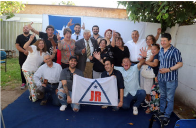
FOTO CON RADICALES ORDENADOS

La jornada finalizó con un vino de honor al estilo Radical.