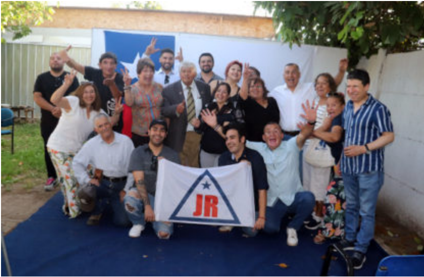
FOTO CON RADICALES ORDENADOS

La jornada finalizó con un vino de honor al estilo Radical.