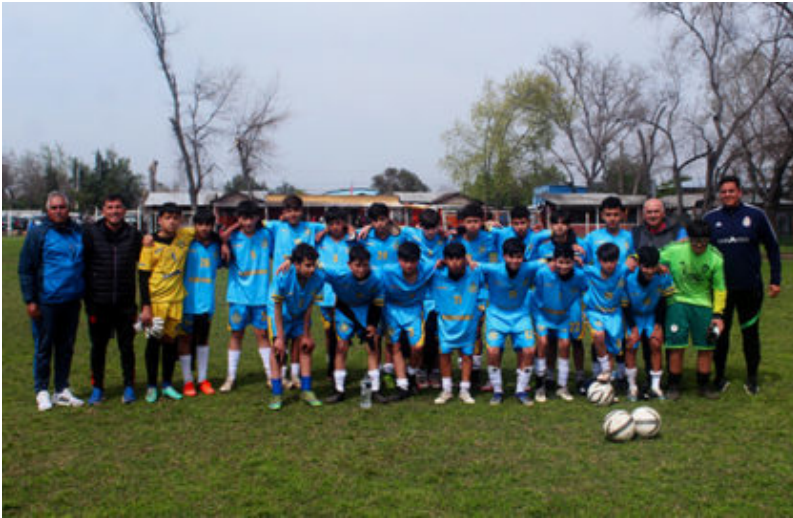
Selección sub 13 de ASHIMA

Este viernes 4 de octubre la selección de la ASHIMA debuta en las clasificatorias regionales para el Nacional sub 13 que organiza la ARFA Metropolitana. Partido se juega en el Estadio Santiago Bueras en programación doble a partir de las 20:00 horas.