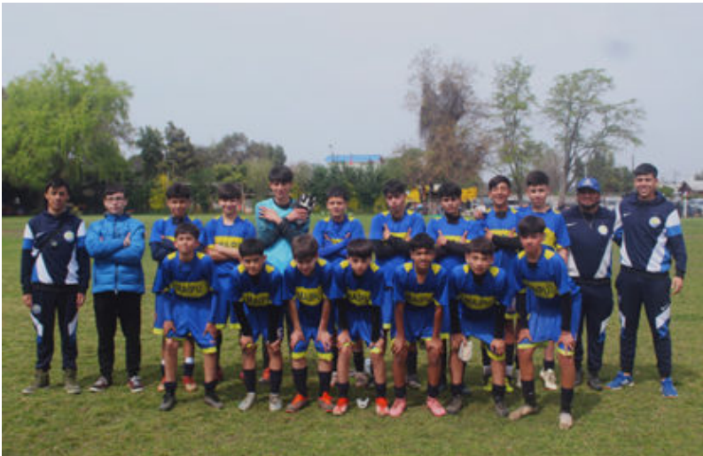
Selección sub 13 de Corfuna

Este viernes 4 de octubre la selección de la ASHIMA debuta en las clasificatorias regionales para el Nacional sub 13 que organiza la ARFA Metropolitana. Partido se juega en el Estadio Santiago Bueras en programación doble a partir de las 20:00 horas.