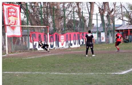
Séptimo de Línea

sumó escasos 9 puntos ante su tradicional rival: Cañón Alonso. Con un buen partido de primera adulto donde sencillamente no pudo convertir. Al menos mejoró con su triunfo en senior "A", puntos que le dolieron a Cañón Alonso ya que le habrían permitido estar en el tercer lugar.