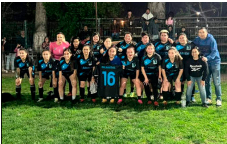
Pajaritos quedó libre esta semana.

Un club que partió conociendo derrotas, pero que nunca aflojó ni se dejó abatir por las goleadas fue sin duda Unión Divina, que ya con la experiencia de un año está logrando frutos y conociendo victorias. A veces discute con pasión los cobros arbitrales, pero aun se mantienen dentro de las normas propias de la adrenalina de competición. Esta vez gana su segundo partido en el campeonato enfrentando a un club recién incorporado: La Arika, que pronto estará acomodándose al campeonato.