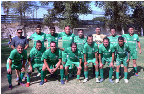
Senior "C" Deportivo Maipú

Novena fecha en juego, si San Isidro lo permite. El campeonato esta entrando en la final de su primera fase al jugarse la penúltima fecha de la primera rueda con tres clubes que ocupan los primeros lugares y que entre ellos lideran 7 series y dos de ellas se reparten los lideratos en las Ramas: Campo de Batalla en Rama Infantil y Abrazo de Maipú Rama Senior y Rama Adulta.