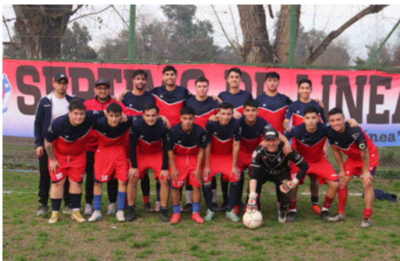
Primera Adulta de Séptimo de Línea.

Esto indica que, de la medianía de la tabla hacia arriba, todos los clubes buscan al menos una medalla en la serie, aunque hay clubes que bajo la tabla han destacado por su constancia en mejorar series y dar la lucha en al menos 3 de ellas.