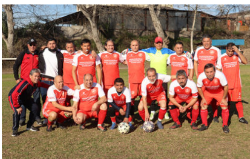
Senior "D" puede obtener su primer triunfo

Dirigentes y jugadores esperan que los 80 m/m de agua que se