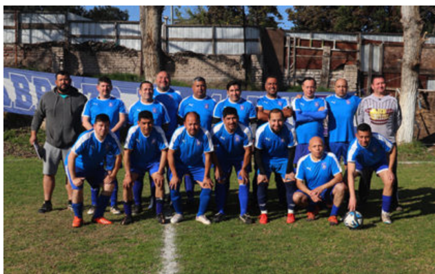
Senior "C" de Abrazo de Maipú

La tabla oficial indica que Viveros es el líder y a 4 puntos se ubica Abrazo de Maipú y Campos de Batalla, todos con posibilidades de ser campeón de la primera rueda, hecho simbólico que estimula a quienes logra ese galardón, pero que apocan quienes no lo logran.