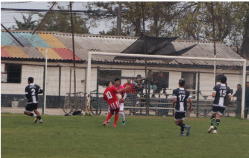
Tabla final y campeones por serie, todas extraoficial, aunque es poco lo que puede variar en resultados, salvo quite de puntos de última hora o castigos en puntaje. Primer partido del Torneo Oficial

Un torneo cuyo objetivo era recaudar dinero y esperar la incorporación de dos clubes concluyó este domingo con amenaza de lluvia que finalmente no se concretó.