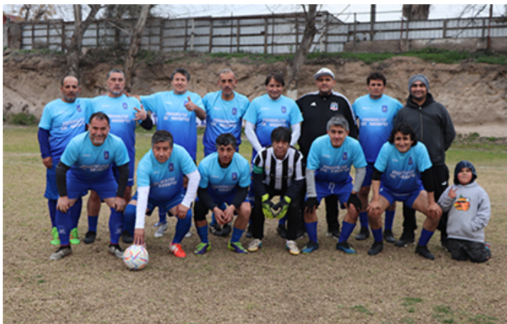
Senior "D" puntero en su serie.

Deportivo tiene un buen trabajo en infantiles, en una Rama apretada que tiene a cinco clubes en la pelea por el primer lugar, con una diferencia de 7 puntos entre el primer y quinto lugar. Sn el caso de Abrazo de Maipú esta recién conociendo victorias en infantiles y solo suma 28 puntos, 30 puntos más abajo de Deportivo Maipú que esta con hambre de ganar en todas sus series, pero no será fácil.