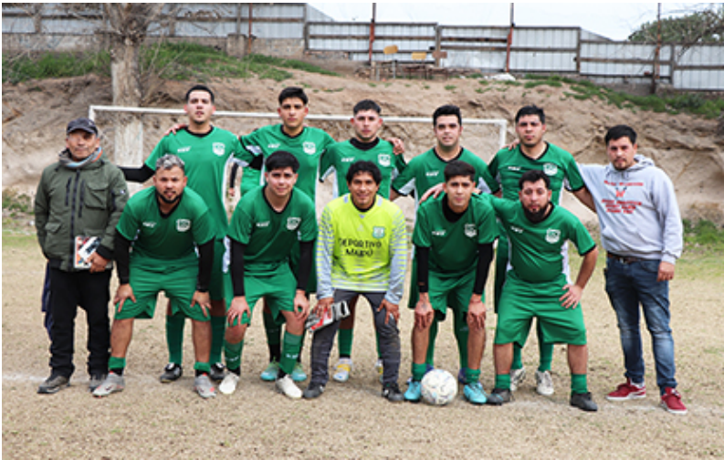
Tercera adulta de Deportivo Maipú

Deportivo Maipú juega de local frente a Abrazo de Maipú en la cancha de éste último. Paradojal, pero Deportivo hace valer su condición de local en esa cancha y sin duda que ambos se la jugaran por mejorar en la tabla de posiciones, con un deportivo que se mantiene en el cuarto lugar, pero ocupó el segundo lugar solo hace unas semanas y con muchos sueños. Por su parte Abrazo de Maipú esta recién tomando el ritmo del campeonato, con algunos jugadores que regresan, pero con falencias en la constancia.