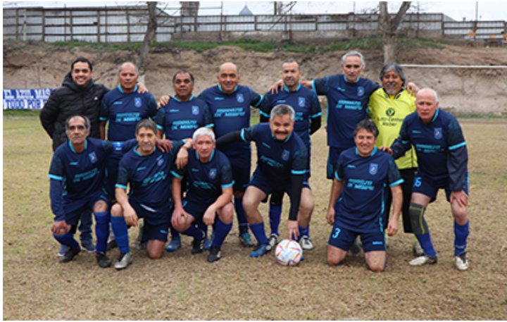
Senior "E" puntero en su serie.