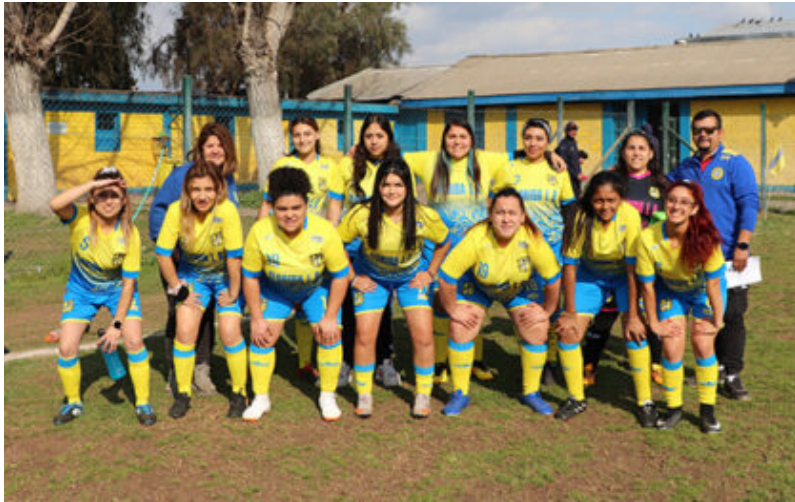
Equipo femenino de Florida Loma Blanca que debuta por los puntos en la segunda rueda del campeonato oficial de la Asociación El Maitén.