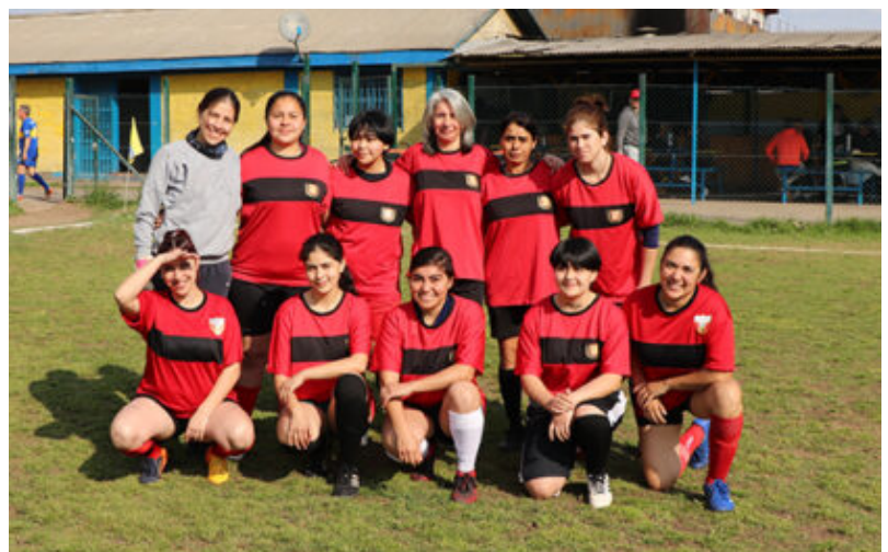
Serie femenina de Julio Sosa que jugó un partido amistoso con su similar de Florida Loma Blanca.

Se observa que ya en cuatro meses de entrenamiento fuerte han logrado asimilar tácticas mínimas para desempeñarse en el campo de juego, con algunas jugadoras que destacan por tener calidad innata a lo que incorporan la astucia femenina y lo demostraron en cancha.