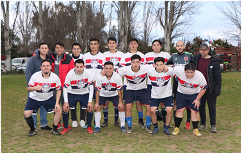
Primera adulto de Séptimo de Línea

Esta segunda rueda los partidos se colocan cada vez más interesantes, especialmente por quienes buscan ser campeón en la genera o ser campeones por serie. Es una de las opciones de Campos de Batalla que tiene punteras a su segunda infantil y sénior "C", mientras que el local Séptimo de Línea tiene 4 series que suman semanalmente y al menos quiere lograr un primer lugar en una serie esta semana.