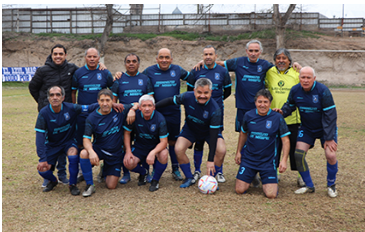
Senior "E" puntero en su serie.

Deportivo Maipú juega de local frente a Abrazo de Maipú en la cancha de éste último. Paradojal, pero Deportivo hace valer su condición de local en esa cancha y sin duda que ambos se la jugaran por mejorar en la tabla de posiciones, con un deportivo que se mantiene en el cuarto lugar, pero ocupó el segundo lugar solo hace unas semanas y con muchos sueños. Por su parte Abrazo de Maipú esta recién tomando el ritmo del campeonato, con algunos jugadores que regresan, pero con falencias en la constancia.