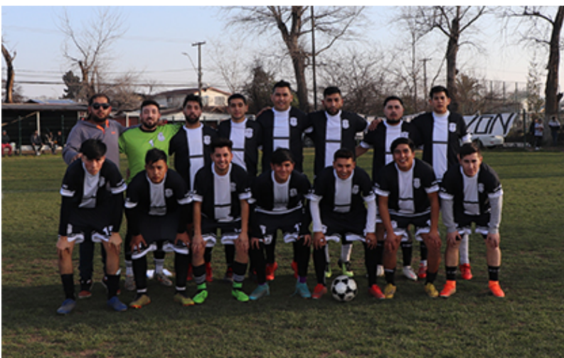
Primera adulto de Campos de Batalla que juega de visitas

Esta segunda rueda los partidos se colocan cada vez más interesantes, especialmente por quienes buscan ser campeón en la genera o ser campeones por serie. Es una de las opciones de Campos de Batalla que tiene punteras a su segunda infantil y sénior "C", mientras que el local Séptimo de Línea tiene 4 series que suman semanalmente y al menos quiere lograr un primer lugar en una serie esta semana.