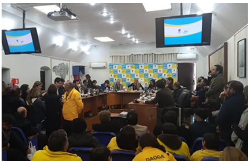
¿Se mantendrá el telón de fondo y las chaquetas amarillas?

95 candidatos son los postulantes hasta el momento los candidatos a concejales por Maipú que representaran a 12 pactos políticos se presentaran en las elecciones que definirán el nuevo Concejo Municipal para el periodo 2021-2024, periodo corto para adecuarse a la extensión de este periodo a causa de la pandemia. 16 candidatos fueron rechazados y tienen plazo 5 días para reclamar al TER