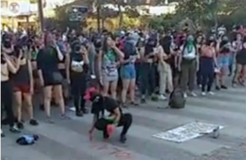
Foto de video presentado el 27 de noviembre frente la Comisaría de calle Bailén..

Performance de "Un violador en tú camino" se mostrará en Maipú este martes 25 de febrero de 2020 en Maipú; se estima que podrían llegar centenar de mujeres con las que se integren en la explanada del Monumento a Los Vencedores, lugar donde se realizará a las 18:00 horas. La organización corre por parte del Comando "Apruebo" en el Plebiscito del 26 de abril.