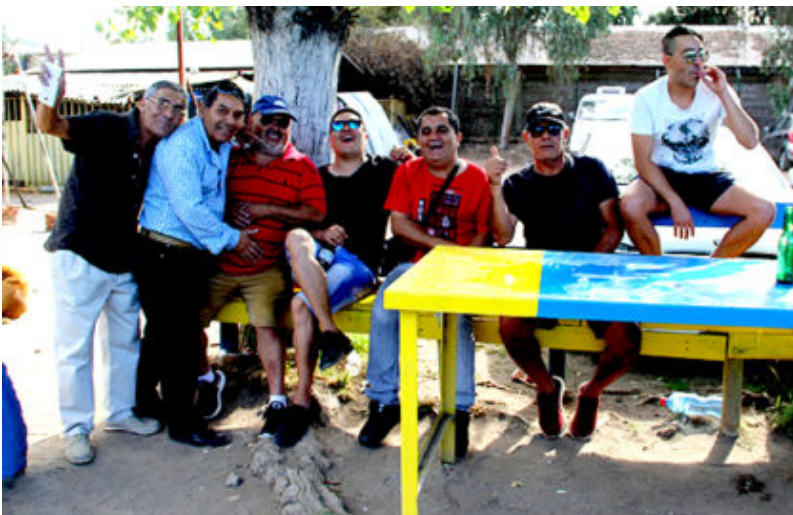
Barra Florida Loma Blanca.

Lamentablemente son dos los clubes cuyos dirigentes no responden los llamados para corroborar resultados, tema que nos complica los resultados sino estamos presentes en cancha, es el caso de esta novena fecha donde aparece en planilla ganando Cañón Alonso a Séptimo de Línea en segunda infantil, resultado que fue al revés. Ganó Séptimo de Línea dos minutos antes del término del partido, pero ese resultado nos pudo llevar a error involuntario.