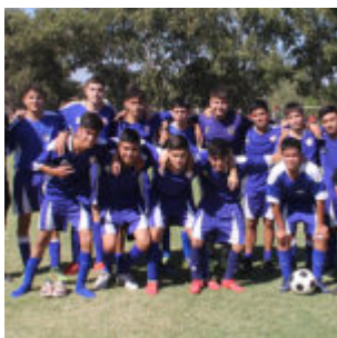
Senior "D" aAbrazo de Maipú, Campeón de la serie Campeonato 2019_2020