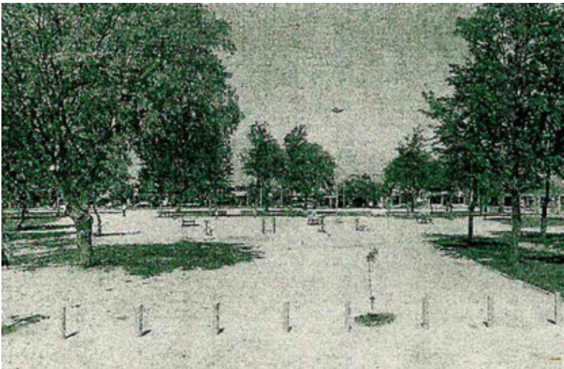
San Martín con Tres Poniente