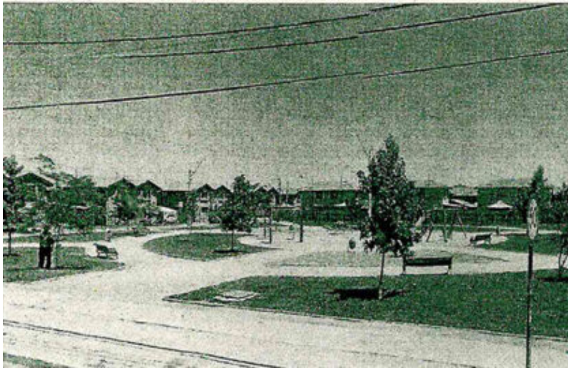
Quilín con Egipto

Como un gran avance en la forma en que se implementaran los juegos infantiles para el uso habitual de niños se mostró el consejero regional Cristian Rubio. El proyecto apronado en el plenario del 1º de julio contempla 5 plazas infantiles protegidos de la radiación solar.