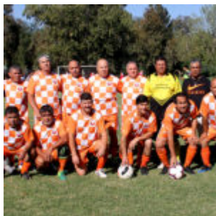
Senior "E" Unión viveros, Campeón de la serie Campeonato 2019_2020