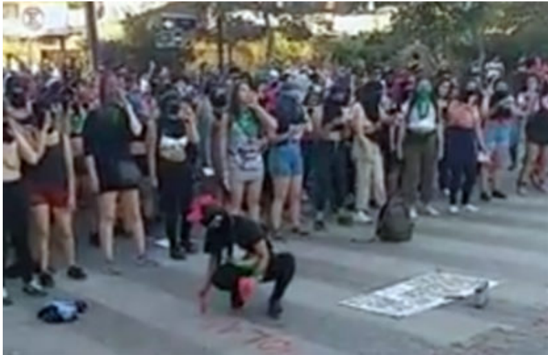
Foto de video presentado el 27 de noviembre frente la Comisaría de calle Bailén..

Performance de “Un violador en tú camino” se mostrará en Maipú este martes 25 de febrero de 2020 enMaipú; se estima que podrían llegar centenar de mujeres con las que se integren en la explanada del Monumento a Los Vencedores, lugar donde se realizará a las 18:00 horas. La organización corre por parte del Comando” Apruebo” en el Plebiscito del 26 de abril.