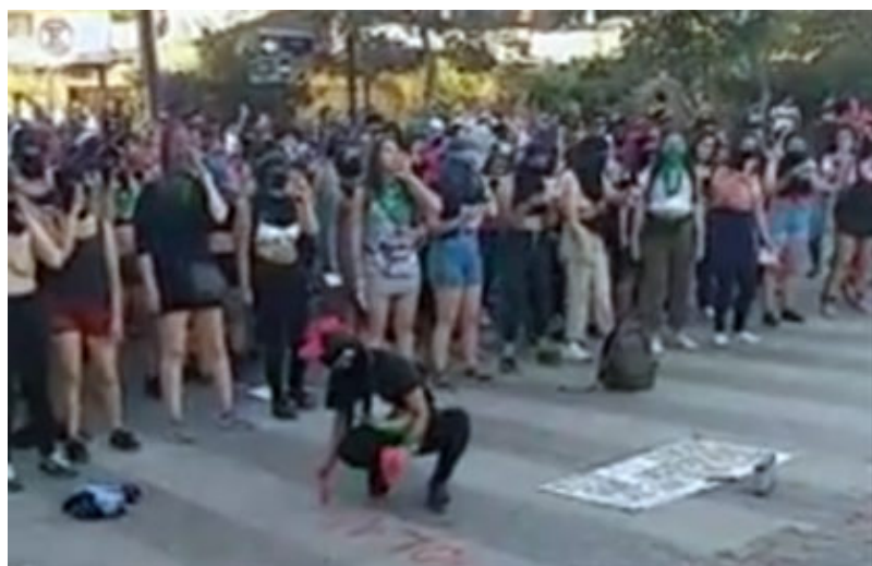
Foto de video presentado el 27 de noviembre frente la Comisaría de calle Bailén..

Performance de “Un violador en tú camino” se mostrará en Maipú este martes 25 de febrero de 2020 en Maipú; se estima que podrían llegar centenar de mujeres con las que se integren en la explanada del Monumento a Los Vencedores, lugar donde se realizará a las 18:00 horas. La organización corre por parte del Comando “Apruebo” en el Plebiscito del 26 de abril.